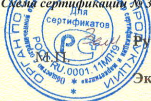
Схема сертификации № 3

ДОПОЛНИТЕЛЬНАЯ ИНФОРМАЦИЯ Маркировка продукции знаком соответствия производится по ГОСТ Р 50460-92. Место нанесения знака соответствия - на изделии и (или) на упаковке и в сопроводительной документации. Часть продукции промаркирована знаком соответствия АИ46.