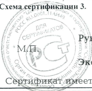
Схема сертификации 3.

Маркировка продукции знаком соответствия производится по ГОСТ Р 50460-92, в соответствии с требованиями в сопроводительной документации