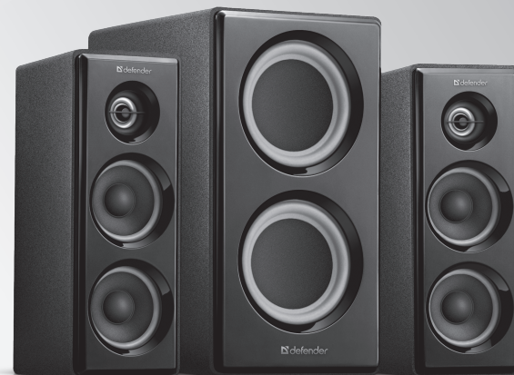
Активная акустическая система 2.1 DEFENDER Avante X35 Инструкция по эксплуатации