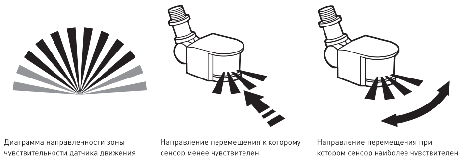
Рис.2. Диаграмма направленности зоны чувствительности.

Датчик движения автоматически включает прожектор при наличии движения в области зоны чувствительности сенсора. Для включения датчика (следовательно и прожектора) при движении в нужной Вам области изделие необходимо установить таким образом, чтобы эта область попадала в зону охвата датчика в соответствии с диаграммой направленности зоны чувствительности сенсорной системы. На рис.2. показано схематическое изображение этой зоны, реальный угол охвата зоны чувствительности указан в Табл.1.