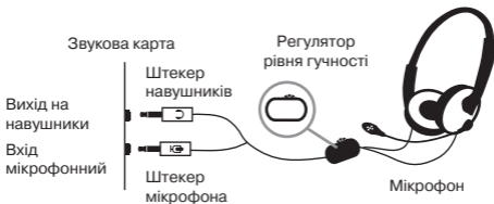
Мал. 1. Схема підключення