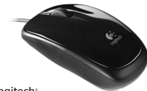
Logitech® Mouse M115

Thank you! Merci! Đakujeme! Дякуємо! Danke! Köszönjük! Dziękujemy! Благодарим ви! Podziękowanie! Dėkojame jums! Tänname! Paldies! Hvala! Zahvala! Poděkování! Vã mulțumim! Hvala vam! Grazie!