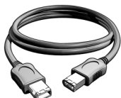
Кабель FireWire 400