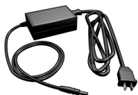
Адаптер блока питания