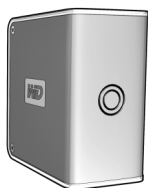
My Book Pro Edition II