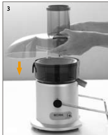
ШАГ 3. Установите крышку соковыжималки на чашу фильтра так, чтобы загрузочный желоб находился точно поверх фильтра из нержавеющей стали.