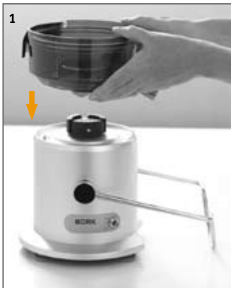
ШАГ 1. Установите чашу фильтра на базу соковыжималки.