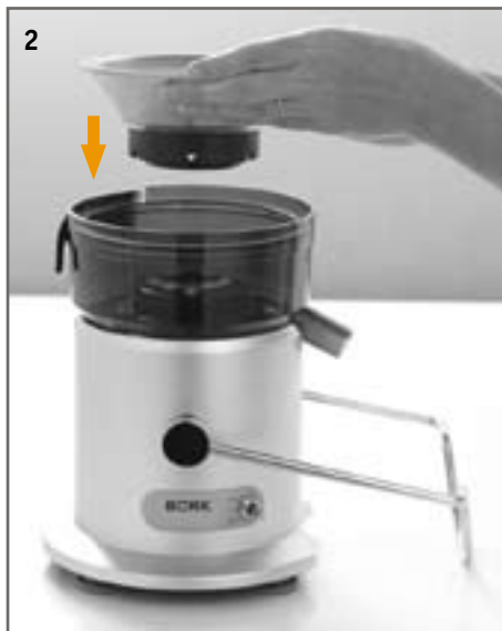
ШАГ 2. Выровняйте стрелки на фильтре по стрелкам на месте стыковки с базой и надавите на фильтр до щелчка. Удостоверьтесь, что фильтр из нержавеющей стали плотно установлен внутри чаши фильтра на базу соковыжималки.