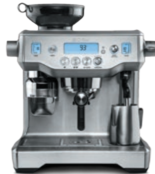
КОФЕЙНАЯ СТАНЦИЯ С805