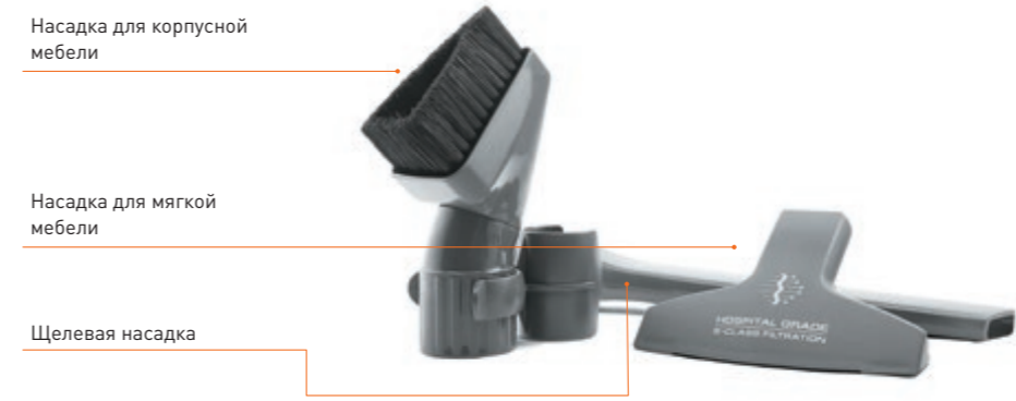
Комбинированная насадка BORK COMBI