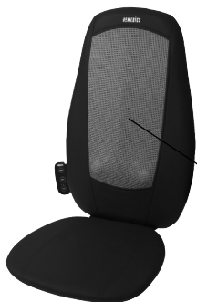
Механизм движущегося массажа шиатцу

Для того, чтобы ощутить успокаивающее тепло, когда массажер включен, просто нажмите на кнопку прогрева. Для того, чтобы отменить выбор, нажмите на кнопку снова. Для Вашей безопасности прогрев не будет приводиться в действие, когда не приведен в действие массаж.