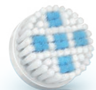
DEEP PORE Cleansing brush head (SC5996)

2 Special needs and care / Soins et besoins spécifiques / Necessità e cure speciali / Speciale behoeften en verzorging / Особый уход и забота