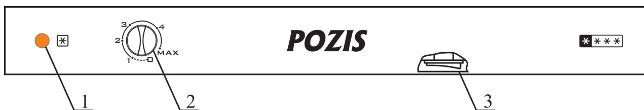
Рис.2 Схема расположения приборов управления и сигнализации

В процессе эксплуатации Вы можете регулировать температуру следующим образом, для понижения температуры в морозильнике поверните ручку терморегулятора по часовой стрелке, для повышения – против часовой стрелки.