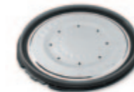
Съемная крышка с уплотнителем