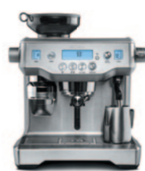
КОФЕЙНАЯ СТАНЦИЯ C805