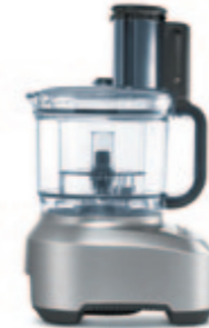
КУХОННЫЙ КОМБАЙН B801