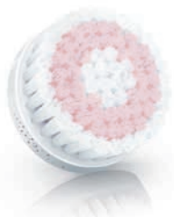
SENSITIVE brush head (SC5991)