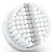
EXFOLIATION brush head (SC5992)

3 Weekly exfoliation / Exfoliation hebdomadaire / Esfoliazione settimanale / Wekelijkse scrub / Ежедневный пилинг