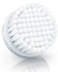
NORMAL brush head (SC5990)