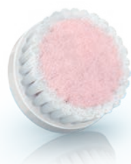
EXTRA SENSITIVE brush head (SC5993)

2 Special needs and care / Soins et besoins spécifiques / Necessità e cure speciali / Speciale behoeften en verzorging / Особый уход и забота