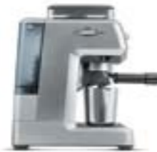
КОФЕЙНАЯ СТАНЦИЯ С801