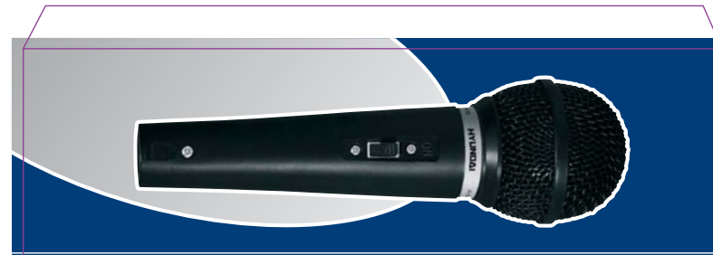
Проводной динамический микрофон / Dynamic wire microphone / H-DM102